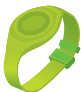
リストバンド (モジュールはバンド部に搭載)